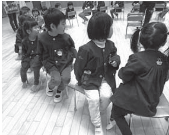
白川保育園の様子