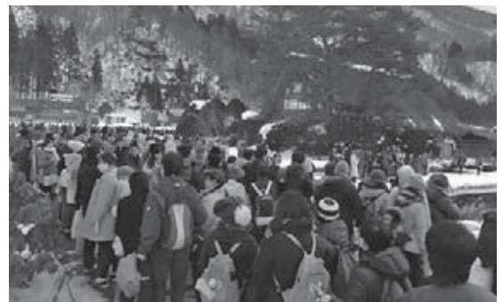
ライトアップ時の和田家付近の様子

摘頂きました。お客様への安全確保の問題や、万が一の事故の際の責任の所在等、3月9日に行われた夜間照明実行委員会において、今後の方向性や改善策について意見を交わしました。対応策の根幹になるのは、予約バス