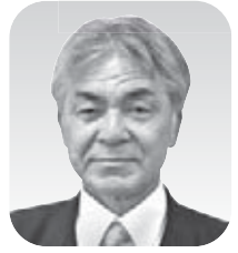
川田 裕 議員