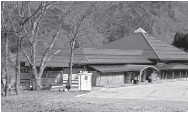
増床予定の「しらみずの湯」