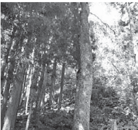
よえもんのシダレザクラの様子

した。その内の3500人（1日平均15人）が入浴利用となっております。また、利用されている皆様は、年齢68歳から93歳で、受付でお名前の記入やお風呂の15cmの段差4段を下りて入浴されております。今後は、しらみずの湯を利用することになりませんが、基本的に健全な方々への案内となっていることや、見守りにしても施設巡回をしているので問題は無いと思われれます。また、休憩室については新たに増床の工事を進めており、快適なサービスを提供出来るものと考えています。しかしながら、これですべて良いとは思っていませんので、ご意見を頂きながら適宜考えて行きたい。