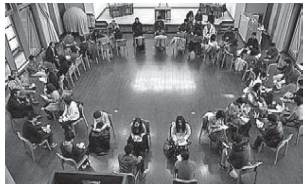
村の婚活事業の様子

白川村が取り組んでいる企業誘致の中で、現在お話を頂いているまたは、進んでいる中で必要とされている労働人口は、正社員とパートを含めて70名程と予想しております。村民の皆様が働いてくれる事をベストと考え、Uターン対策に「広報しらかわ」等の村の機関紙を送付したり、携帯電話等によるネットワーク作り、村の情報提供を細目に伝えたいと考えます。また、村外から移住される方々を迎える為には、空家活