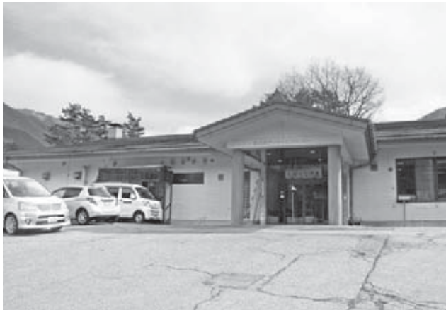
デイサービスセンター「しゃくなげ荘」