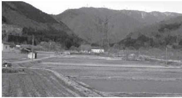
高級旅館の建設予定地