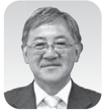
高桑 徹司 議員