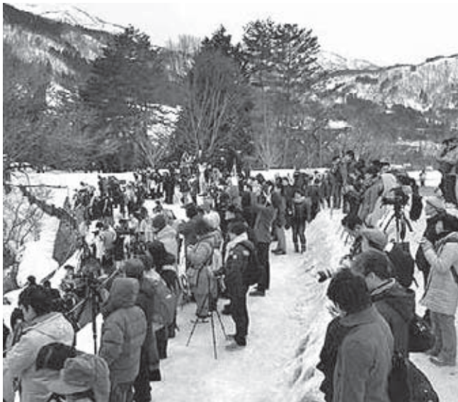
ライトアップ時の展望台の様子

シーが大幅に増えたことにより、寺尾駐車場は大混雑でした。また、人気の展望台は、例年がない雪不足で鑑賞スペースも少なく、混雑に拍車をかけました。議員からご指