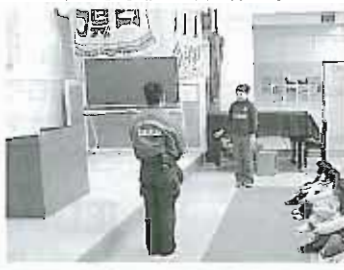
～平瀬小学校避難訓練風景～