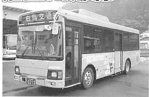
※実際運行するバスの車体には、合掌造りのイラストも描かれています

4月1日(日)から、白川村と郡上市を結ぶ定期路線バスが運行を開始します。郡上市と白川村を直接バスで結ぶことにより、村民の足としての公共交通の確保と、観光客の流れを国道156号線にも作ることで、沿線地域の発展につなげるための観光路線としても期待されます。