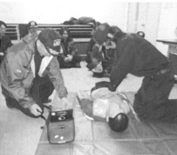
救命講習を受講する消防団員

3月1日から、4日間にわたり、中部分団の皆さんが、救命講習を受講しました。消防団員の皆さんには定期的なこのような講習を受けていただいています。村民の皆さんも、いざという時のために救命講習を受講しましょう。