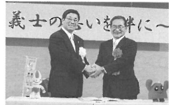
握手を交わす両県知事

両県は直線距離で700km以上離れており、同時に被災する可能性が低いことから、昨年11月に「災害時相互応援協定」を締結し、どちらかの県で災害が発生した場合、もう一方の県が迅速かつ集中的に支援することとしました。