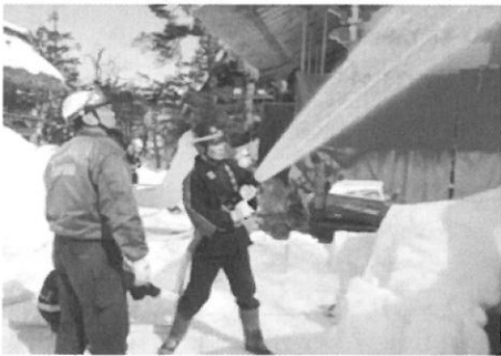
放水を行う消防団員

訓練には消防団員、文化財関係者、駐在所、消防署が参加し、それぞれの役割や連携を確認しました。世界的にも重要な白川村の文化財を守るため、防火意識を一層高めましょう。