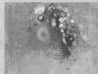
オディロン・ルドン [青い花瓶の花々] 1904年頃

岐阜市宇佐 4-1-22 ☎058(271)1313 休 / 月曜日 (祝日の場合は翌平日) 開館時間 / 10:00～18:00