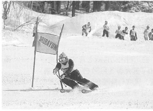
第46回白川村民スキー大会・ 第38回白川村議会議員杯スキー大会