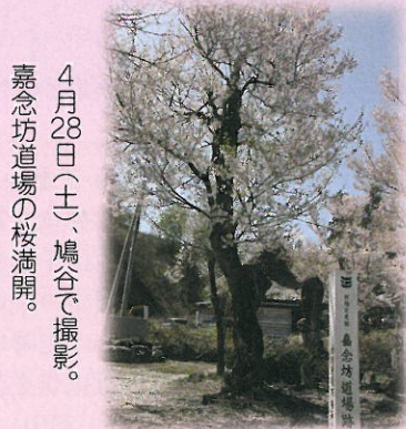
4月28日(土)、鳩谷で撮影。嘉念坊道場の桜満開。