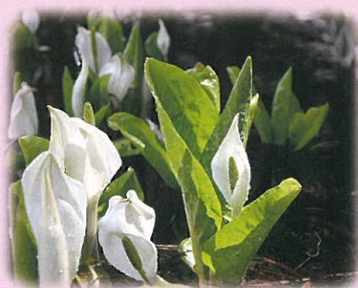
4月25日(水)、大窪池で撮影。雪解け水の中で、水芭蕉が力強く咲いていました。