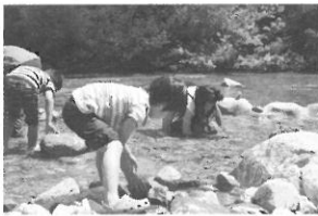
魚のつかみ取りの様子

旬の夏野菜の収穫や魚のつかみ取りなどの日帰り体験から、農家民宿でのお泊り体験まで、豊かな自然や農林漁業を満喫できるメニューが盛りだくさんです。キャンペーンでは、抽選で県産品などを100人にプレゼントします。