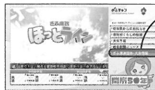
ぎふちゃん(8ch) データ放送トップ画面