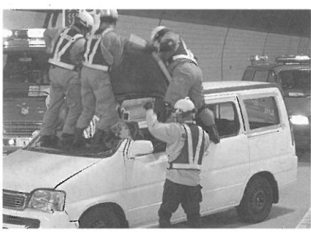
事故車両から負傷者を救助