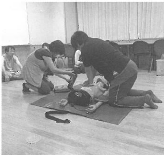
心肺蘇生訓練の様子

7月12日、夏休みを前に、白川小学校PTA29名のみなさんが、救急講習を受講されました。万が一に備え、みなさんに心肺蘇生法やAEDの使用方法など、救命処置について学んでいただきました。