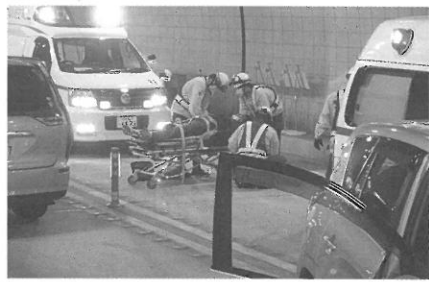
救助した負傷者に応急処置を実施

7月2日、東海北陸自動車道防災訓練に参加しました。この訓練は、毎年この時期、夜間工事通行止に合わせ行われているもので、本年も警察やネクスコの関係者ら総勢46名で実施されました。訓練は、飛騨トンネル内において乗用車3台が絡む交通事故が発生し、うち1名が車内に閉じ込められているとの想定で行われ、各関係機関が情報伝達や安全確保、救助、救急搬送など、それぞれの役割を実践し、いざという時に備え、連携を深めました。