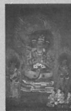
国宝 絹本着色五大尊像 のうち降三世明王像 (米振寺蔵)

山田貢 一越縮緬訪問着 「ながれ」1957 年 (世田谷美術館蔵)