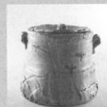
荒川豊蔵「志野水指」 1938-41 年

多治見市東町 4-2-5 ☎ 0572(28)3100 休 / 月曜日 (祝日の場合は翌平日) 開館時間 / 10:00 ~ 18:00