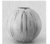
林恭助「黄瀬戸壺」 2009 年

県下で活動を続ける若手陶芸家や陶磁器デザイナーの作品によって、現在、そしてこれからの M I N O を紹介します。 9 月 1 日 (土) ~ 11 月 11 日 (日) 観覧料 / 一般 500 円 大学生 400 円