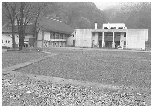
▲旧小学校施設解体事業