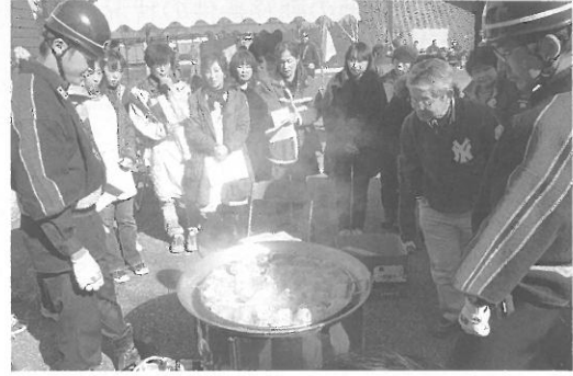
▲総合防災訓練事業