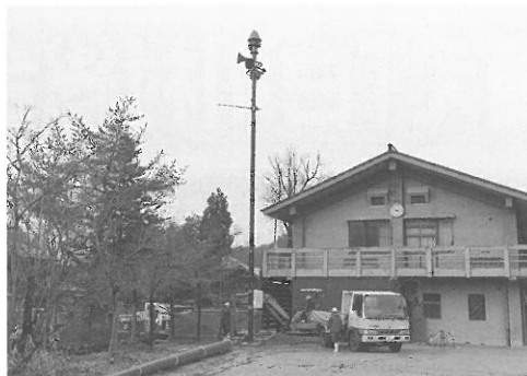
▲防災行政無線設備改修事業