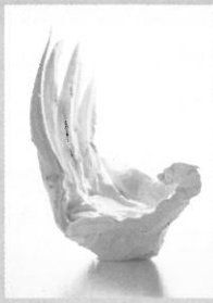
加藤委 (サンカクノココロ)

岐阜市宇佐 4-1-22 ☎058(271)1313 休 / 月曜日(祝日の場合は翌平日) 開館時間 / 10:00～18:00 企画展開催時の第 3 金曜日は夜間開館日 10:00～21:00(入場は 20:30 まで)