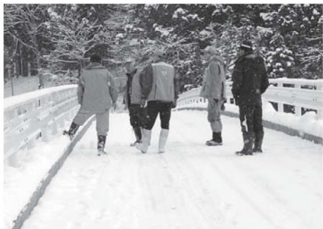
猟友会によるパトロール

白川村民の安心安全な生活を確保するため、飛騨猟友会白川支部の方に有害鳥獣を捕獲していただいております。今年度にあつては、イノシシ23頭、ツキノワグマ18頭、ニホンザル3頭、ニホンジカ1頭の計45頭を捕獲しました。ツキノワグマが大量に出没した事から、有害捕獲の総数として昨年度対比約6倍となる捕獲量となりました。また、今年に入り1月11日に個体数調整としてカモシカを5頭捕獲しました。猟友会の方は、集落付近に有害鳥獣が出没した場合には、それぞれ日々の仕事や生活がある中、時には仕事や家庭の都合を中断して地域の安心安全のため危険を顧みず果敢に取り組まれています。