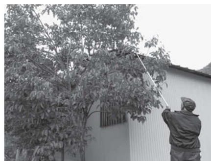
果実などはエサになる前に確実に収穫しましょう

鳥獣のなかには狩猟の対象とならないものがあります。代表的なものは特定天然記念物であるカモシカですが、ニホンザルも狩猟の対象とされていません。ニホンザルを捕獲するには年間を通して有害捕獲の手続きが必要となり、出沒情報の提供が強く望まれます。