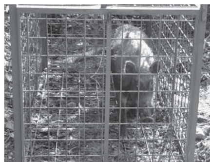
集落周辺に生息するイノシシ

出沒を防ぐには、鳥獣の数を減らすとともにエサとなる誘引物を除去する必要があります。捕獲や農地の進入防止柵管理とあわせて必要な対策となります。