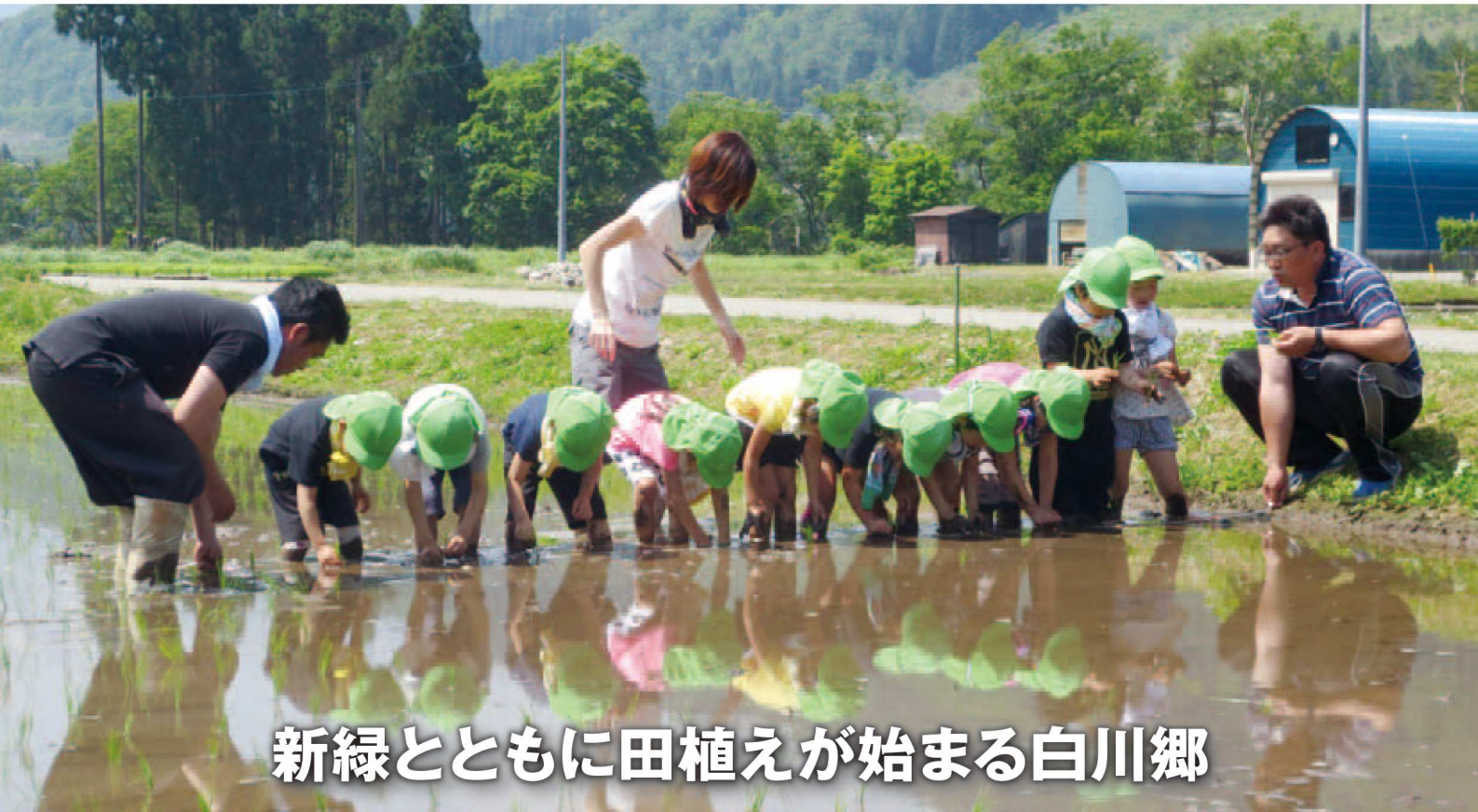
新緑とともに田植えが始まる白川郷