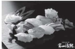
富山湾の新鮮な海の幸と県産米を使った「富山湾鮎」

高速道路が定額で2日間乗り降り自由となる「ぐるっと飛騨・富山ドライブプラン」が実施されます。今年、世界文化遺産登録20周年を迎える五箇山の合掌造り集落とともに富山湾の新鮮な海の幸を食べに富山へ出かけてみませんか。