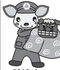
こあんちゃん 高山地区交通安全協会 白川支部