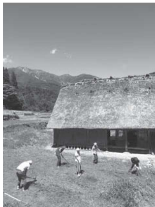
クワやツルハシで作業