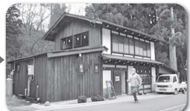
外観アフター (2016年12月撮影)