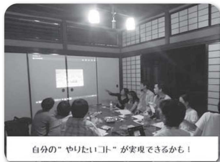
自分の“やりたいこと”が実現できるかも!

合掌を組み立てることが目的ではなく「みんなで力を合わせることを最優先に取り組めたことがよかったです。材を運ぶことやハコマキは一人でできることですが、子どもたちと力を合わせて作業をすることで信頼関係が築けました。職人さんが楽しく教えてくれたので、子どもたちも白川村ならではの仕事を身近に感じて将来の選択肢が増えたようです。仕事や生活を変えることにはエネルギーが要るので、私たち人人は年齢を気にしたり諦めたりしがちですが、子どもと一緒にもっと色々な体験をして感動をして、もっと自由に生きていってもいいのではないかと思います。(福田)