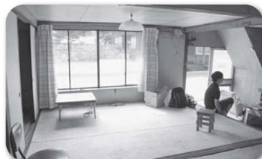
内装ビフォー (2016年9月撮影)