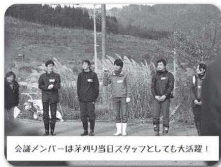
会議メンバーは茅刈り当日スタッフとしても大活躍!