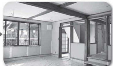
内装まだ途中 (2016年12月撮影)