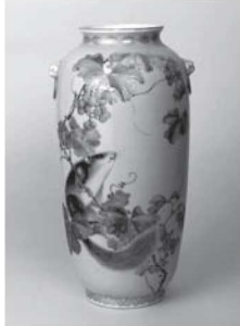
明山舎・名古屋 《上絵金彩葡萄に栗鼠図花瓶》 明治時代

明治時代、華々しい発展を遂げた日本の陶磁器業。精緻な陶磁器の制作を可能にした分業体制や技術の進展、出来上がった陶磁器がどのようにして海を渡ったのかといった舞台裏に迫りながら、明治時代の美濃焼そして各産地の作品をご紹介します。