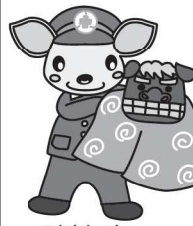
こあんちゃん 高山地区交通安全協会 白川支部