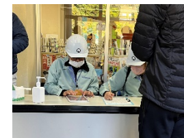
避難訓練でのタブレット活用