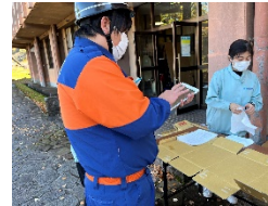
タブレットを活用した避難者チェックの実施