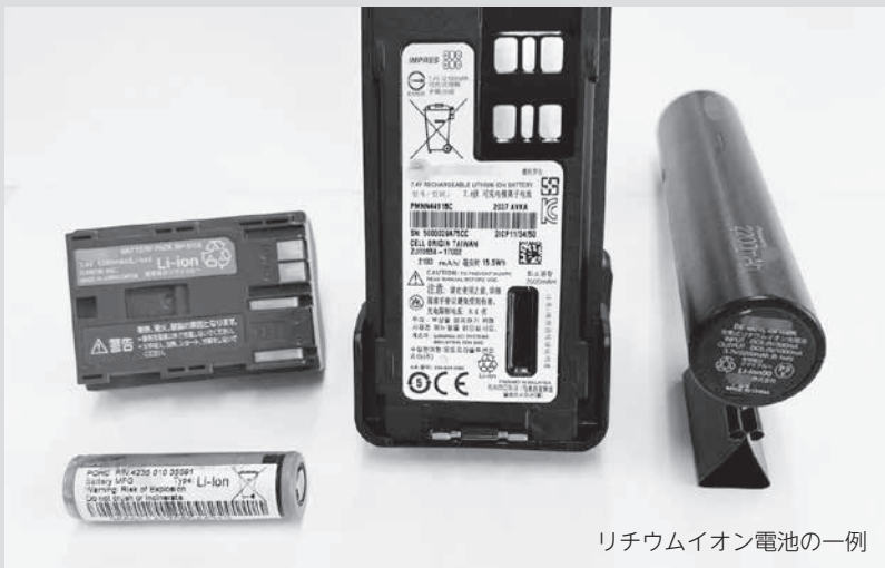
リチウムイオン電池の一例

充電して使用する家電に組み込まれている小型充電式電池（主にリチウムイオン電池）の不適切な処分による、ごみ収集車やごみ処理施設の火災が全国的に多発しています。ひとたび火災が発生すると、消火活動だけではなくその後のごみの収集や処理に甚大な影響を及ぼし、私たちの日々の生活に多大な被害を与えることとなります。