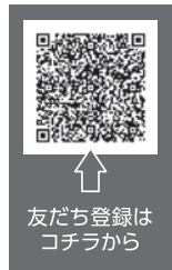
LINE公式アカウント画面

市町村の避難情報などをLINEトーク画面上で受け取ることができます。ぜひ友だち登録をお願いします。