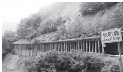
平成30年7月豪雨で発生した崖崩れ(尾神地内)

特にこれからの時期、大雨等により、土砂災害の発生が懸念されます。日頃から防災意識を高め、災害に備えましょう。