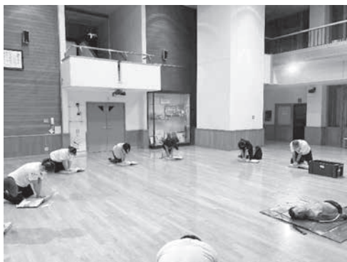
白川郷学園での救命講習の様子