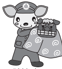
こあんちゃん 高山地区交通安全協会 白川支部