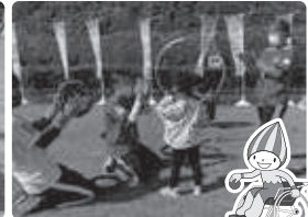
ぎふ清流レクリエーションフェスティバル2021の様子