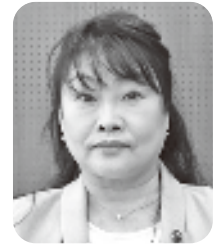
坂本 正代 議員