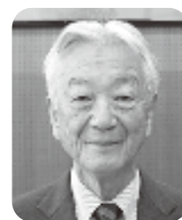
森崎 敏克 議員