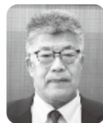
川田 一浩 議員

Q 荻町集落では、大変ありがたいことに国内外問わず、多く観光のお客様によって賑わいを見せてはいますが、反面、敷地内や家の中への無断侵入、ゴミのポイ捨て、歩行者と車との接触事故が危惧されていますが、村の対応についてお聞かせ下さい。